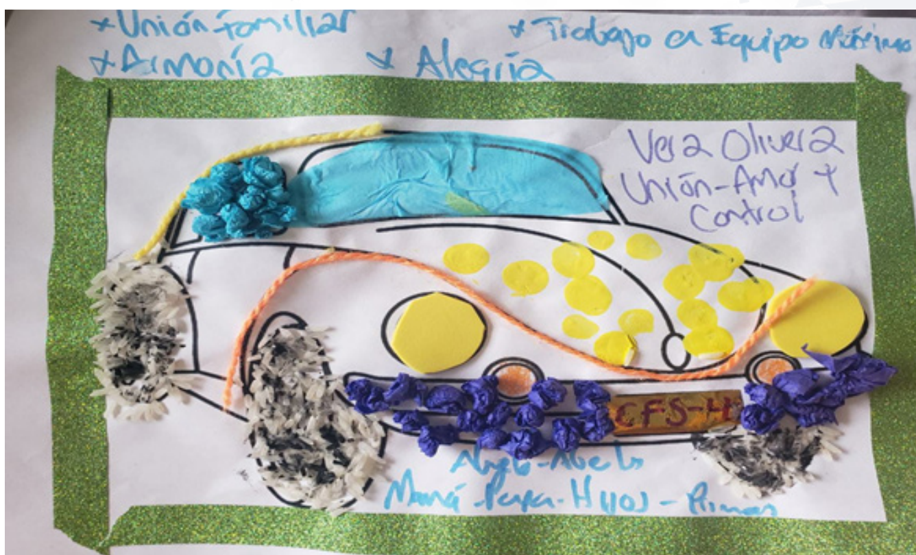
Figura 1. Actividad unidad de significación de organización “el carro familiar”

Por otra parte, la libre expresión y la unión familiar durante el ejercicio de las actividades, fueron la base del desarrollo de un espacio que resignificó experiencias vividas a lo largo del tiempo a nivel personal y familiar en el marco de la pandemia. Allí, afloraron sentimientos de alegría y nostalgia al recordar aquellos seres que ya no están y que también han dejado un legado de amor y entrega a la familia.